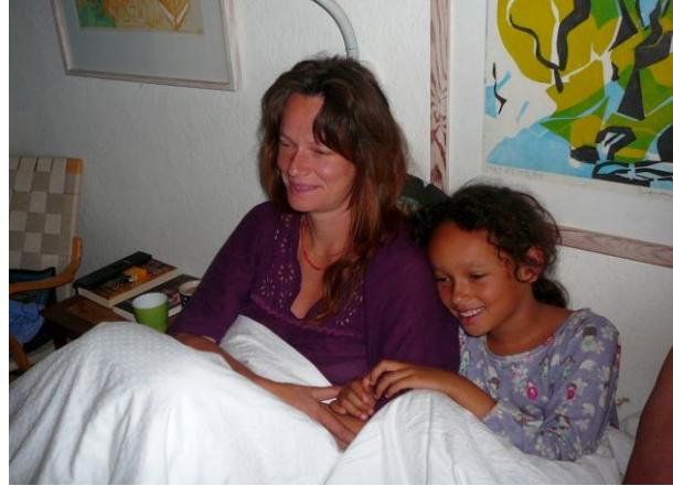
Jordbær og Ramasjang i fjerneren

Det er en dramatisk tid, vi gennemlever med globalisering, oprør i de arabiske lande, klimaproblemer og nu sidst opbrud i EU. Den kommende ”stabilitetspagt” er vist slem, men måske er det trods alt bedre at være med på Titanic end at sidde i åben båd alene på Atlanterhavet. Vi følger begivenhedernes gang i pressen.